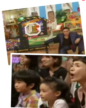
日本TV：メレンゲの気持ち